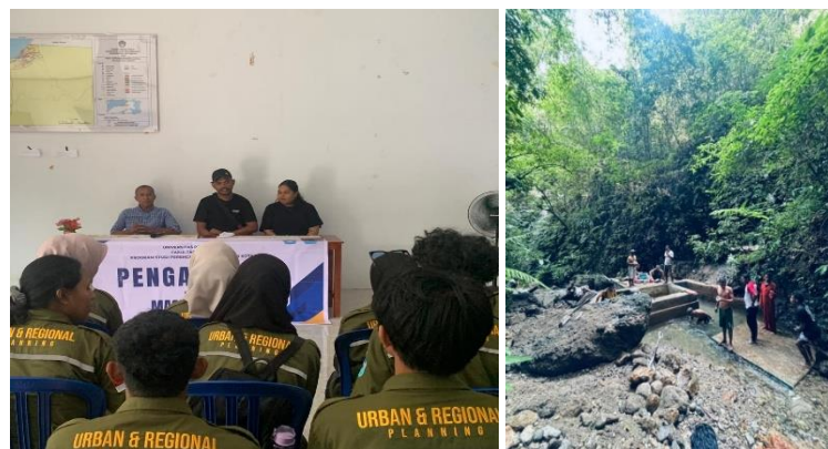
Gambar 1. Kegiatan survei lapangan & pengumpulan data primer