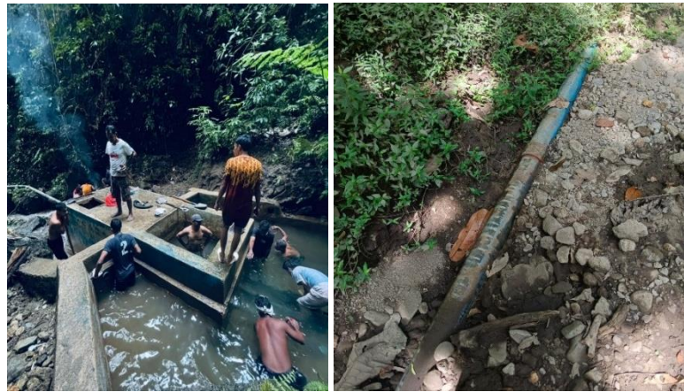
Gambar 3. Sumber air bersih & jaringan perpipaan di Negeri Mamala

Secara ilmiah, temuan ini menunjukkan bahwa sistem pelayanan air bersih di Negeri Mamala memiliki struktur sistem terpusat sederhana, yaitu pelayanan air bertumpu pada sejumlah kecil sumber air yang selanjutnya didistribusikan melalui jaringan perpipaan ke wilayah permukiman. Pola seperti ini umum dijumpai pada wilayah pesisir dan perdesaan yang memanfaatkan sumber air lokal secara langsung tanpa sistem pengolahan dan distribusi yang kompleks. Ketergantungan pada tiga titik sumber air menunjukkan bahwa keberlanjutan layanan air bersih di Negeri Mamala sangat dipengaruhi oleh keberadaan, kapasitas, dan kontinuitas debit dari sumber-sumber tersebut.