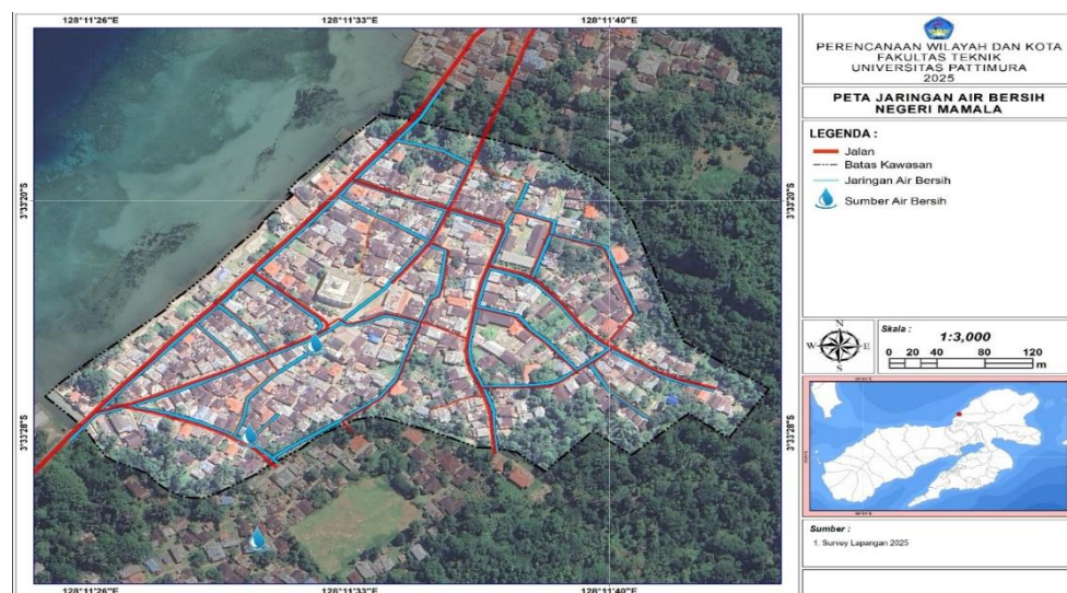
Gambar 2. Peta jaringan air bersih di Negeri Mamala, Kecamatan Leihitu