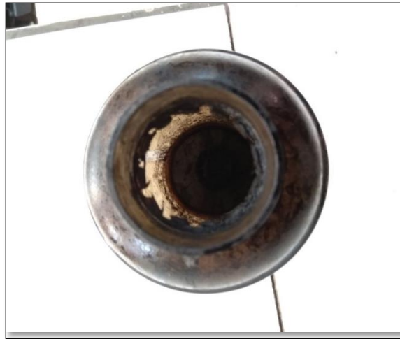
Gambar 5. Hasil char dan debu

pirolisis beroperasi pada suhu 200 dan suhu gas masuk ke cyclone adalah dengan suhu 50. Kemudian alian akan masuk ke cyclone dan disaring di dalam cyclone , partikel berupa char dan debu akan masuk kedalam penampungan dan gas bersih akan di teruskan menuju kondensor dan motor