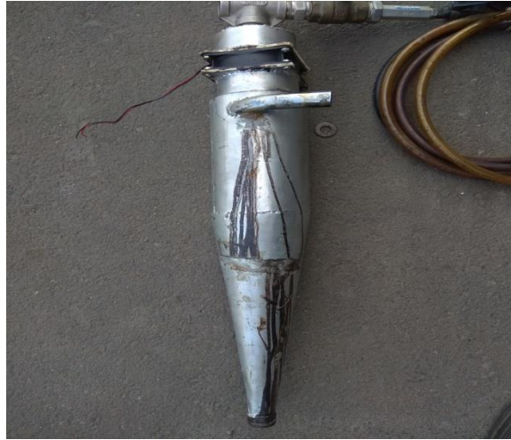
Gambar 3. Cyclone

Pada proses perakitan ini dengan memasang kipas komputer pada bagian yang sudah di rencanakan sehingga membentuk satu bagian cyclone .