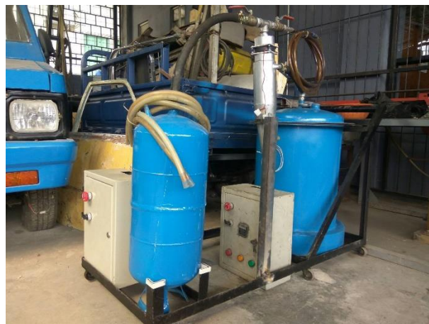
Gambar 4. Rangkaian pirolisis

Pada proses ini cyclone dipasang setelah proses pemanasan pada tabung reaktor, pada penyambungan ini di pasang dengan pipa elastis tahan panas, masuk melalui saluran input. Pada saluran output di pasang keni T, yang berfungsi untuk mencabangkan saluran, menuju kondensor dan motor.